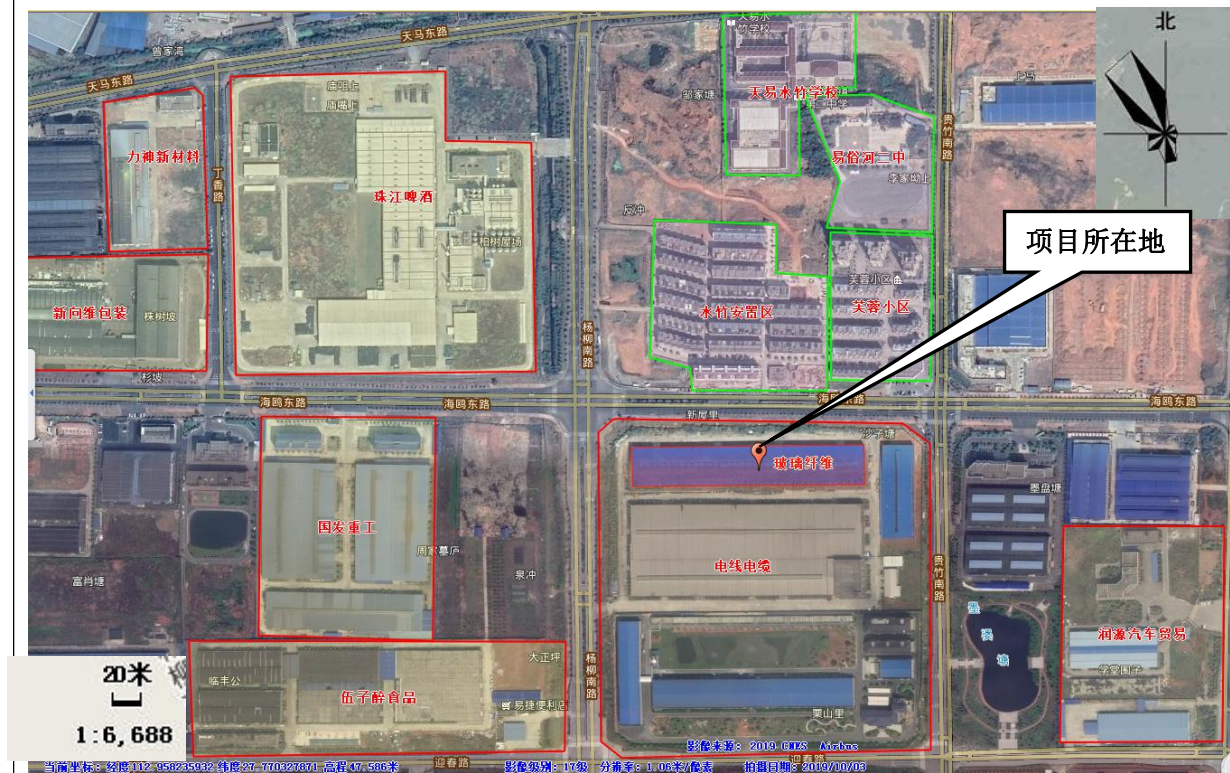
图 3-1 项目周边环境保护目标分布图