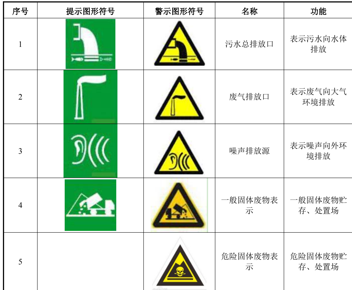
表 7-9 环境保护图形标志一览表

建设单位如实填写《中华人民共和国规范化排污口登记证》的有关内容，由环保主管部门签发登记证。建设单位应把有关排污情况如排污口的性质、编号、排污口位置以及主要排放的污染物种类、数量、浓度、排放规律、排放走向及污染治理设施的运行情况建档管理，并报送环保主管部门备案。